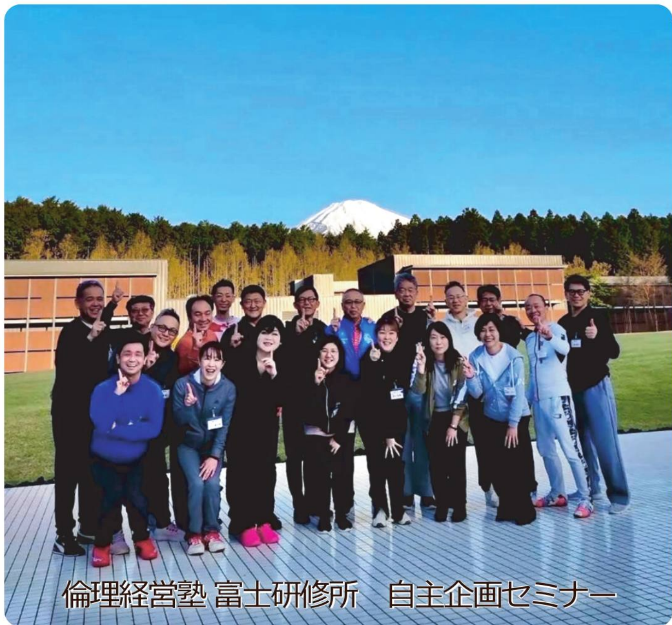
倫理経営塾 富士研修所 自主企画セミナー