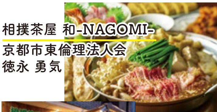
相撲茶屋 和-NAGOMI- 京都市東倫理法人会 徳永 勇気

漢方では、症状だけで判断するのではなく、個人個人の状況、状態等も重要視しているため、対面による相談を中心に行っています。機器で煎じ薬を煎じるサービスもしております。人の健康維持の為に、より漢方を発展させるよう取り組んでいます。