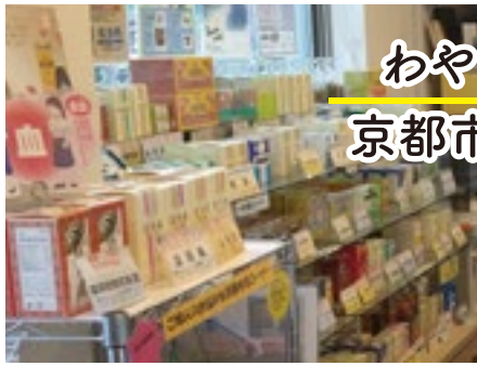
わやくや千坂薬局 京都市倫理法人会 千坂 武司