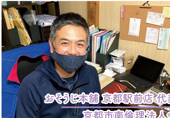
おそうじ本舗 京都駅前店 代表